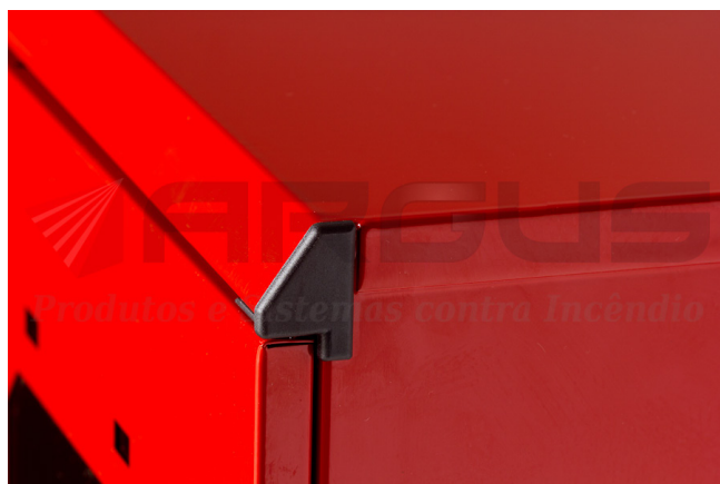
Detalhe da cantoneira