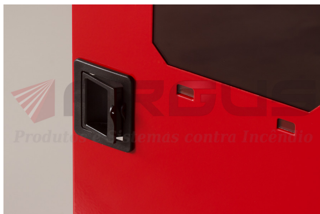
Detalhe do fecho tipo easy-click